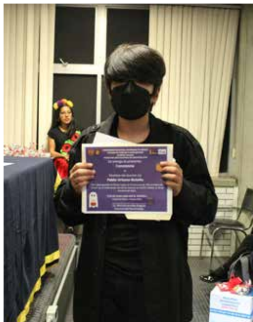
FOTOGRAFÍA: PABLO URBANO BOTELLO, 1ER LUGAR. ARCHIVO DEL CCH VALLEJO