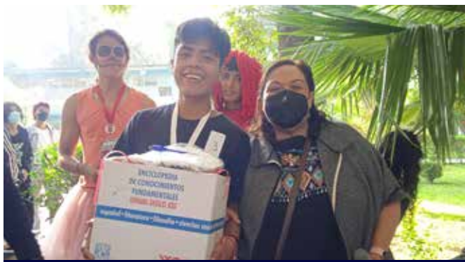
3er LUGAR VARONIL

El evento reunió a más de 70 personas, incluidos profesores y personal que labora en el plantel, que se unieron a nuestras cecehacheras y cecehacheros e hicieron gala de sus disfraces, maquillaje, pero sobre todo de su buena disposición y actitud.