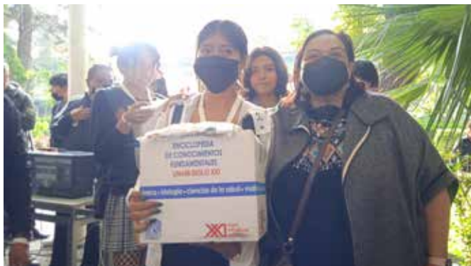
2o LUGAR FEMENIL