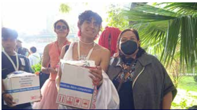
2o LUGAR VARONIL