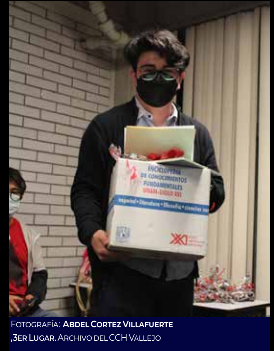
FOTOGRAFÍA: ABDEL CORTEZ VILLAFUERTE 3ER LUGAR. ARCHIVO DEL CCH VALLEJO

"Los ganadores se hicieron acreedores de una enciclopedia, un libro de colección, una memoria USB de 32 gigabytes y una bolsa de dulces como parte de su calaveritas".