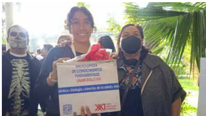
3er LUGAR FEMENIL