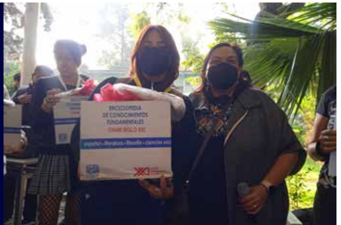
FOTOGRAFÍA: ARCHIVO DEL CCH VALLEJO TER LUGAR FEMENIL

Las festividades por el día de muertos en el plantel Vallejo iniciaron con actividades recreativas y la encargada de abrir esta jornada fue la denominada “carrera de zombies” organizada por el departamento de educación física turno matutino.