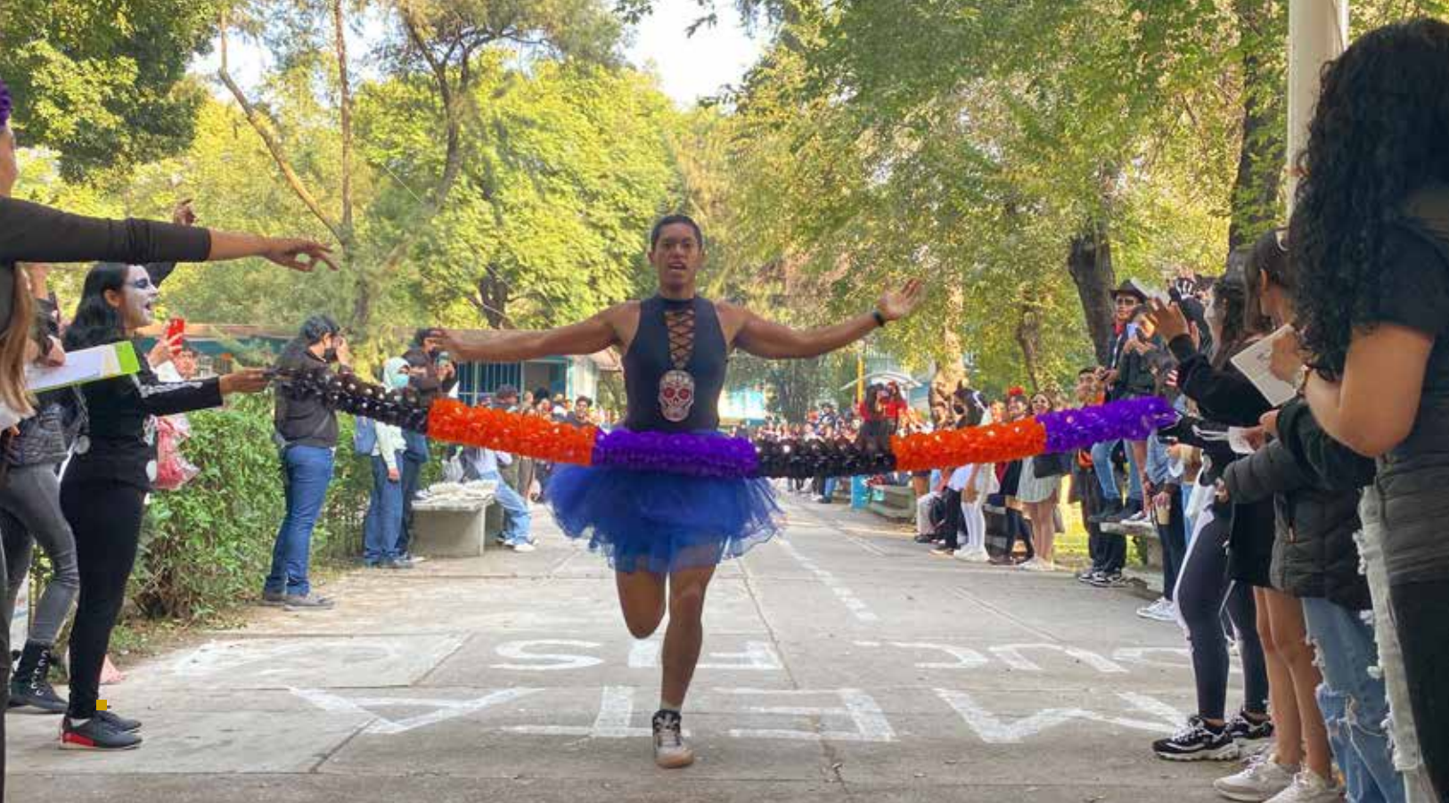
TER LUGAR VARONIL