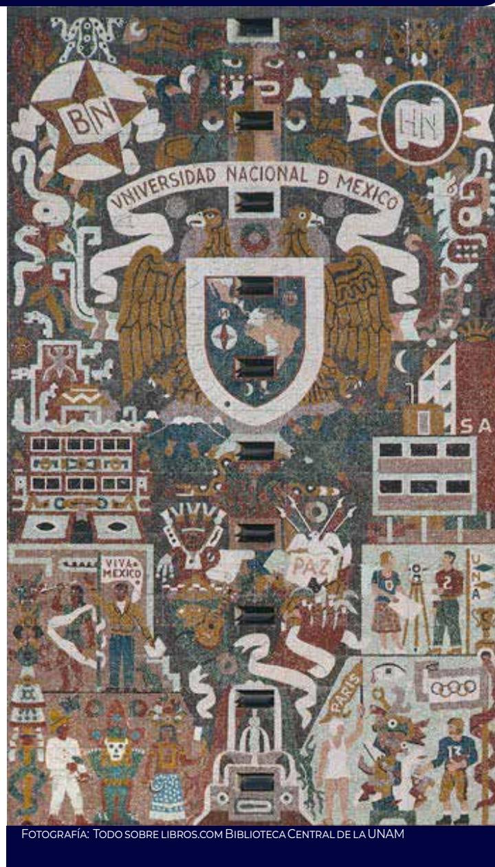
BIBLIOTECA CENTRAL DE LA UNAM

El muro sur retrata la llegada de los españoles a México y la conquista, la dualidad dios-diablo y los cambios históricos generados por iglesias, cañones, mapas, monjes y códices.