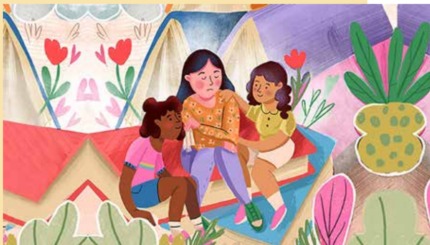
ILUSTRACIÓN: SALUD EMOCIONAL PARA MUJERES MIGRANTES. INSTITUTO DE LOS MEXICANOS EN EL EXTERIOR

tomando en cuenta los estándares internacionales. La violencia sexual, psicológica, física y económica hacia las mujeres migrantes es una forma de discriminación que impide la aplicación de los derechos humanos y se agrava al conjuntarse con el estatus migratorio irregular en el país. Las mujeres migrantes no denuncian y, si lo hacen, las consecuencias pueden ser aún peor, como sociedad no podemos permitir que estos actos de violencia se normalicen y se repliquen. Tal parece que existir y permanecer en la tierra se está convirtiendo en un privilegio.