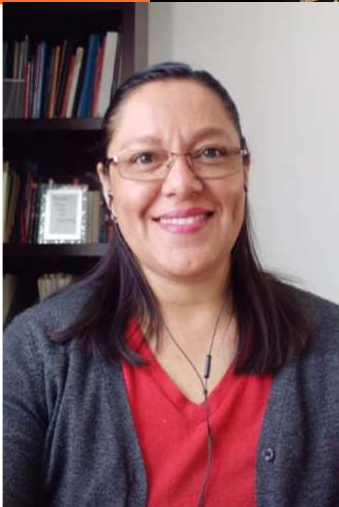
MÓNICA MONROY GONZÁLEZ

“Me parece que es una oportunidad de conocer la Universidad un poco más a fondo y desde otras perspectivas que uno no ve cuando solo esta desde su Área y su disciplina, de conocer los mecanismos que hacen funcionar nuestra universidad y de alguna manera de aportar mi experiencia y mi visión como parte de una de las comisiones, apoyando también el trabajo de los compañeros consejeros,” comentó la maestra.