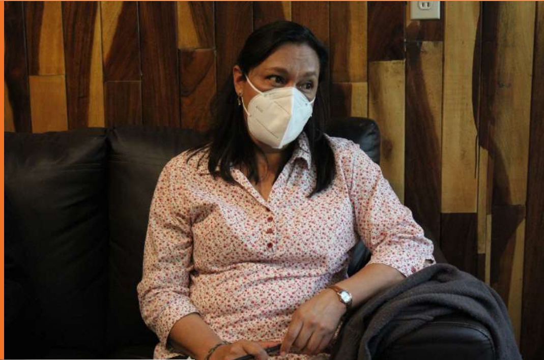
MÓNICA MONROY GONZÁLEZ