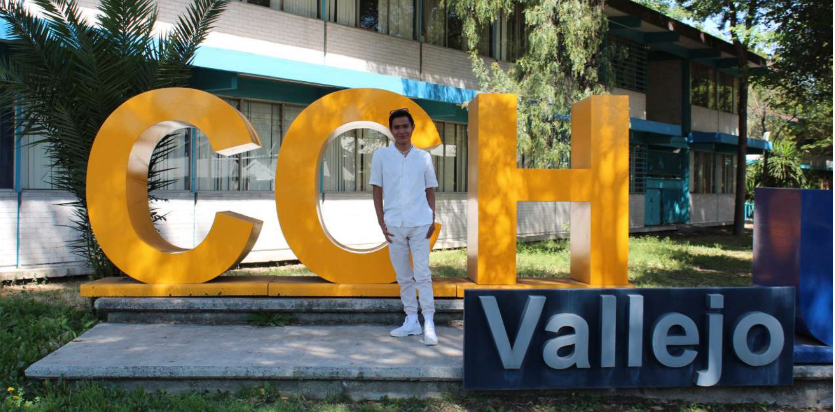
JESÚS USIEL NAVARRO RODRÍGUEZ