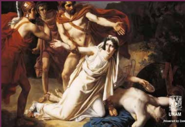
IMAGEN: ARRESTO DE ANTÍGONA, UNAM.