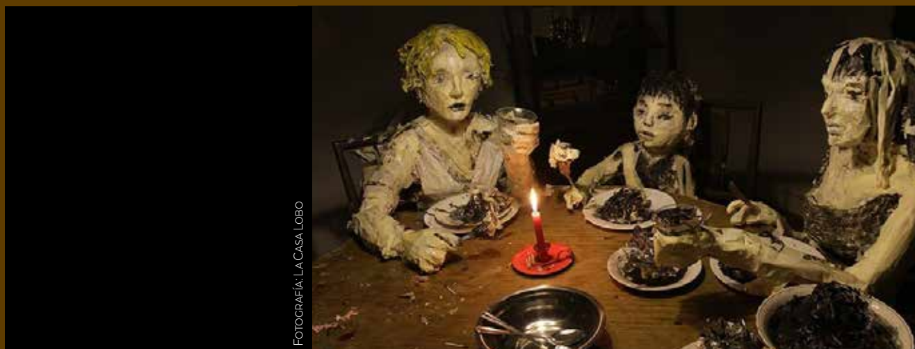
FOTOGRAFÍA: LA CASA LOBO

El largo metraje hace varias metáforas con sus personajes, jugando con la realidad y con los elementos fantasiosos de los