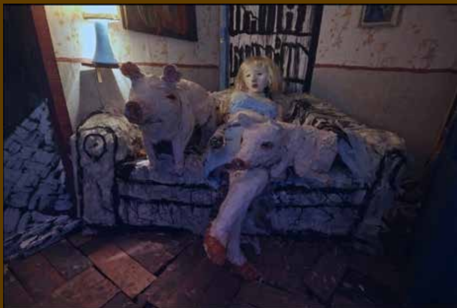
FOTOGRAFÍA: LA CASA LOBO

cuentos de hadas u otros relatos infantiles que conocemos, como Los tres cerditos o los anuncios que se usaban para la campaña nazi.