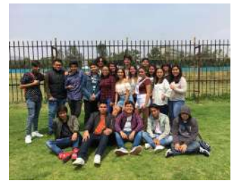
Alumnos del CCH Vallejo

del CCH, y uno de los más importantes de la UNAM y de México.