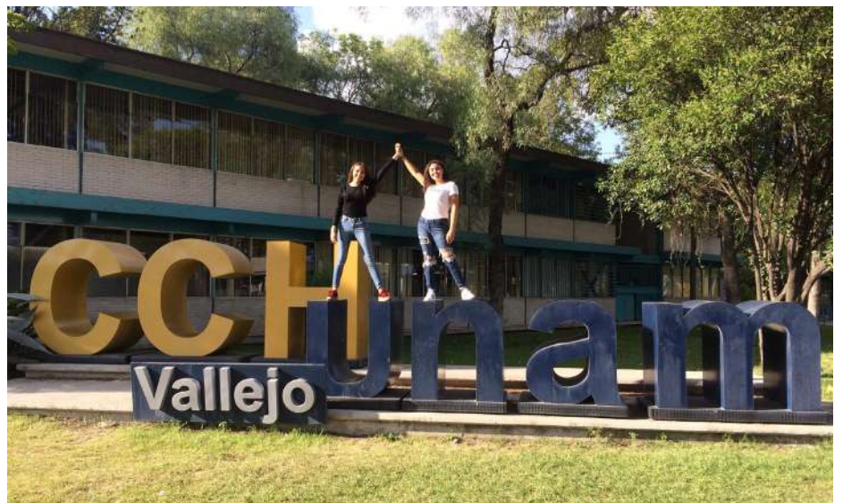
Alumnas del CCH Vallejo

En el marzo, de 2018, del Día mundial de la poesía, el plantel tuvo la presencia de Jaime Sabines Córdova, hijo del poeta chiapaneco Jaime Sabines, quien charló con los asistentes a la conferencia sobre su trabajo y la obra de su padre. Para abril, se llevó a cabo la tercera edición del Cecheachero Film Fest, el Festival Internacional de Cine