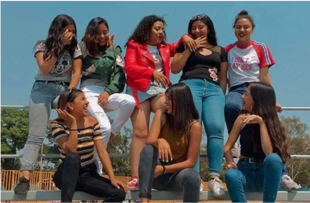
Alumnas del CCH Vallejo