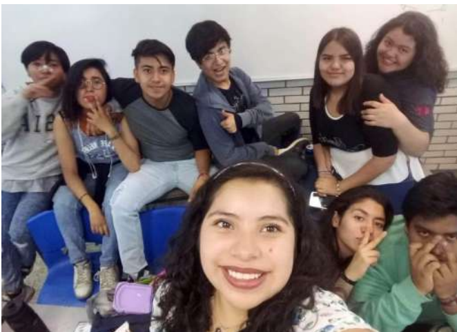
Alumnos del CCH Vallejo

Este 21 de agosto, concluye oficialmente el semestre, muchos de ustedes parte rumbo a las diferentes escuelas y facultades de nivel superior de la UNAM, desde aquí les deseamos lo mejor en su trayectoria universitaria, ¡muchas felicidades! ✓