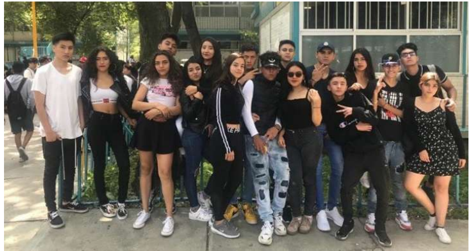
Alumnas del CCH Vallejo

hachera, la edición 45 de los Juegos Deportivos Intra CCH, quien los vivió, sabe que la pasión que tienen los jugadores para defender a su plantel pone la piel chinita.