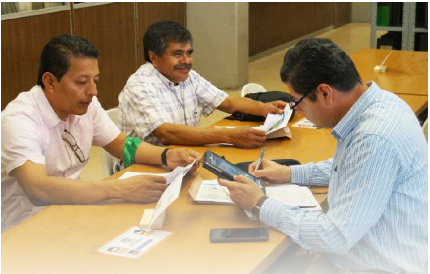
Profesores trabajando

82 grupos atendidos en el turno vespertino