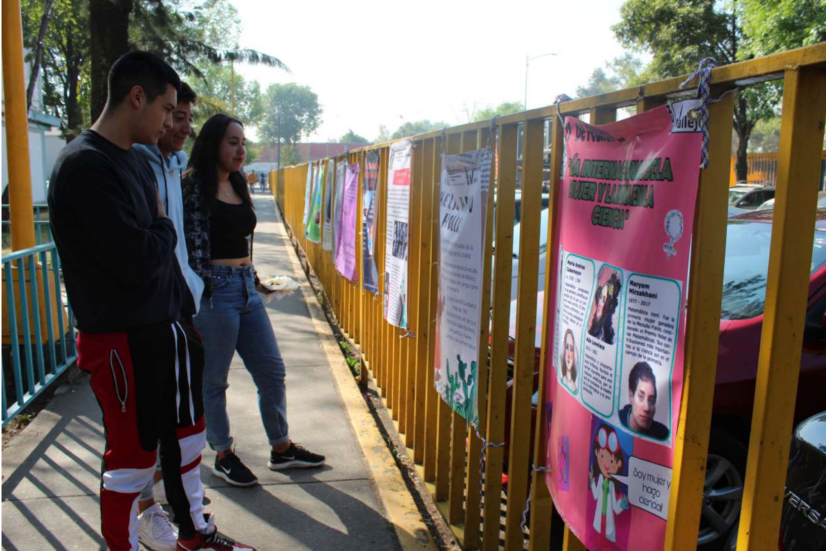
Alumnos recorriendo la exposición de carteles

Alumnos de la asignatura de Química I participan en la actividad